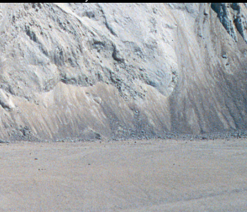
Canteras de yeso

confección de fiambres crudos y cocidos, operan además cualificadas firmas que, revalorizan los métodos tradicionales, trabajan y comercializan morconcillos naturales de carnero, cerdo y buey, elaborados a partir del intestino de los animales de matadero, y de otras partes, como vesículas de bovino y de cerdo.